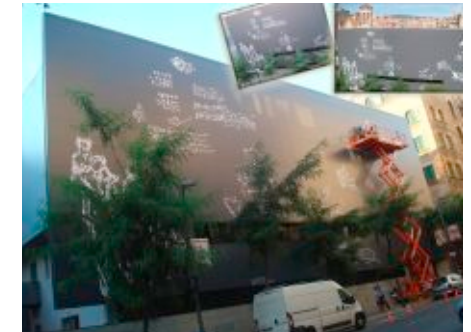
Premio Letra en la categoría Miscelánea