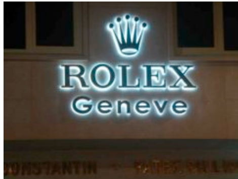
Rótulo corpóreo retroiluminado

Además, proporcionamos todo tipo de sistemas de iluminación, desde los habituales neones a los sofisticados equipos de leds.