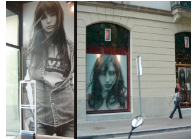
Impresión digital para escaparatismo e interiorismo