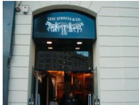
Cajón luminoso con aluminio fresado