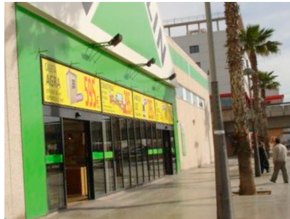
Impresión digital para exteriores