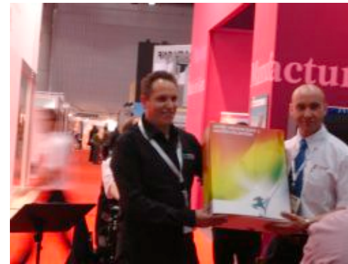
Entrega de premios