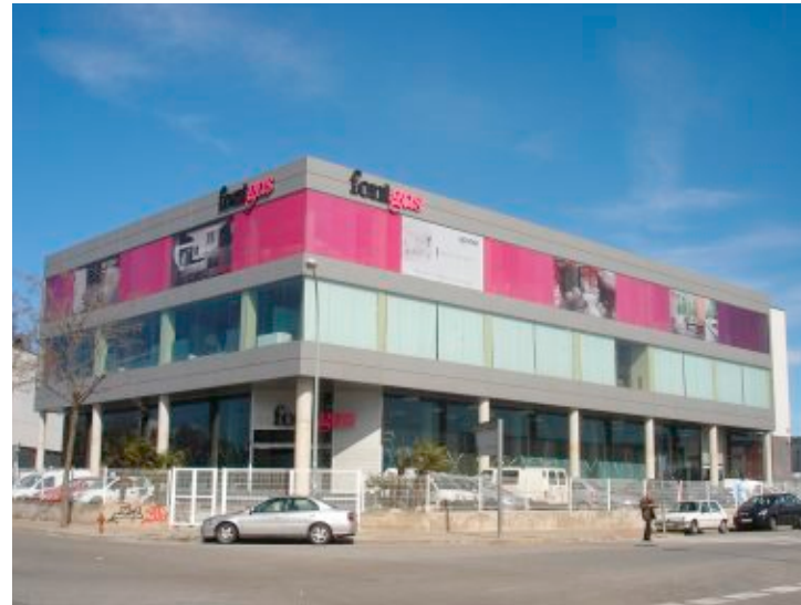
Rotulación en fachada con vinilo microperforado impreso