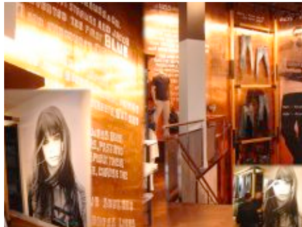
Premio Letra 2008 al Mejor trabajo de rotulación de interiorismo estable

En esta edición nos presentamos en 2 categorías y en las dos resultamos ganadores.