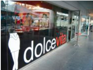
Foto escaparate exterior